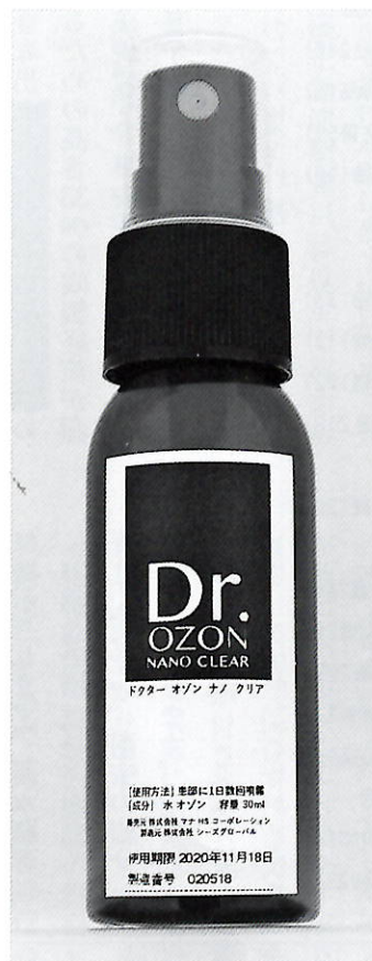
オゾン水スプレー

オゾン水はアルコールや塩素などに比べ除菌効果が600〜3000倍と高く、人体にも安全で、さらに一度に必要な使用料が少ないことから環境にも優しいため、近年は駅や学校でウイルス対策などを目的に取り入れられています。